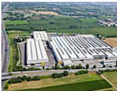
Eredi Gnutti Metalli, i