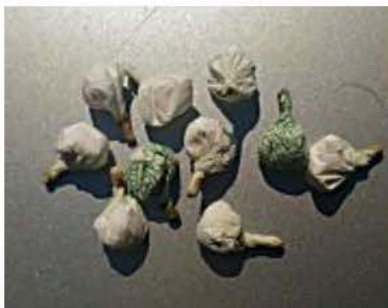
Spaccio di droga in via