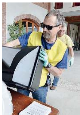
Il «baratto». Una delle precedenti edizioni di Scambio di stagione