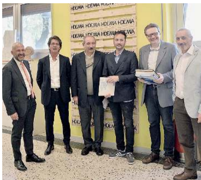
Collaborazione. Intesa tra Brescia Infrastrutture e Hdemia S. Giulia

Allo studio una mostra al Mo.Ca e altre iniziative per far conoscere l'opera in tutti i suoi aspetti